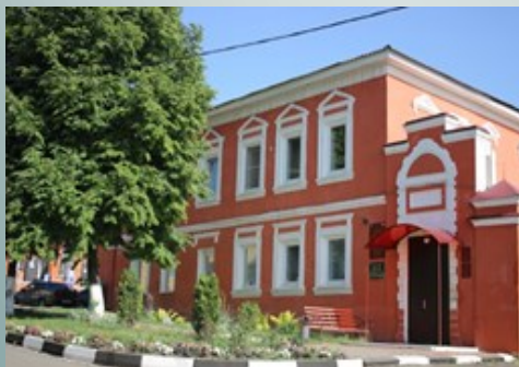
График работы: Понедельник-пятница с 08.00 до 17.00 Перерыв: с 12.00 до 13.00

Приглашаем Вас воспользоваться услугами нашего Центра!