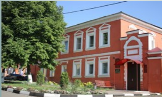
График работы: Понедельник-пятница с 08.00 до 17.00 Перерыв: с 12.00 до 13.00

УПРАВЛЕНИЕ СОЦИАЛЬНОЙ ЗАЩИТЫ НАСЕЛЕНИЯ АДМИНИСТРАЦИИ КОРОЧАНСКОГО РАЙОНА